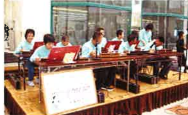
平和堂アルプラザ水口