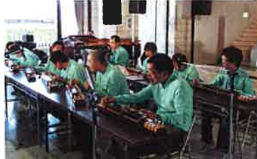
石部文化ホール ロビー