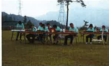
ドギーズパーク滋賀