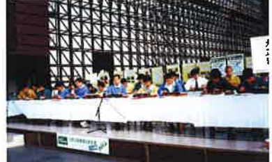
京都駅室町小路広場