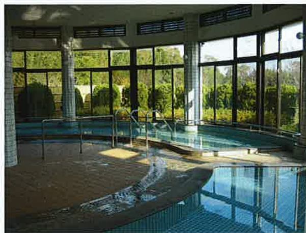
一般浴槽・リフト浴槽