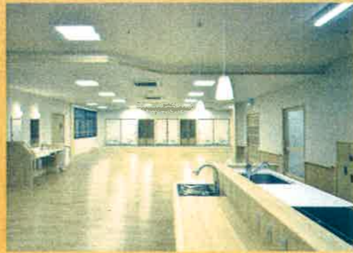
多目的室と一体の食堂